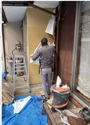
改装工事も増えてきました。 大工さんが下地中。