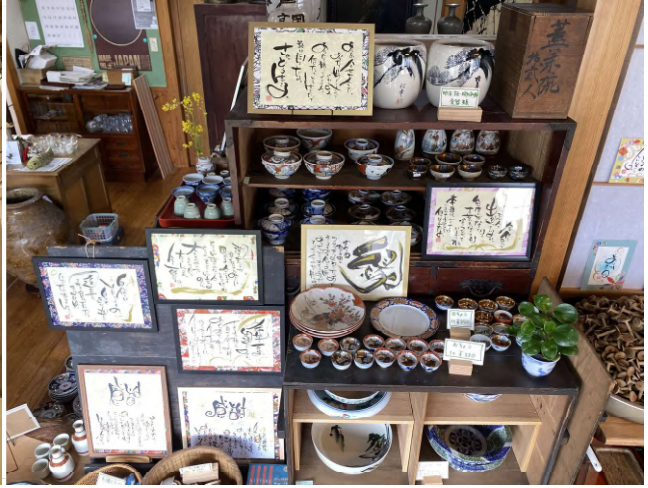
いえまちの店内にも、作品をたくさん飾りました。