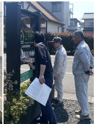
自社看板をリニューアル。 完了チェックをする社長。