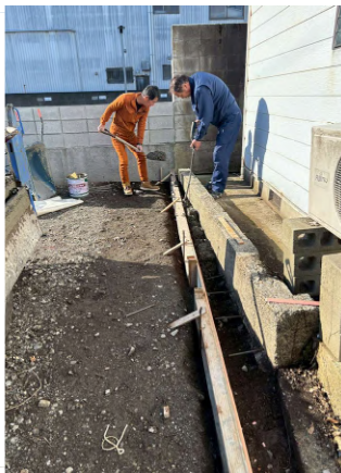
地境のコンクリートを 手作業で打設しています。