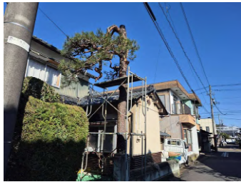
足場を立てての松の木の伐採作業