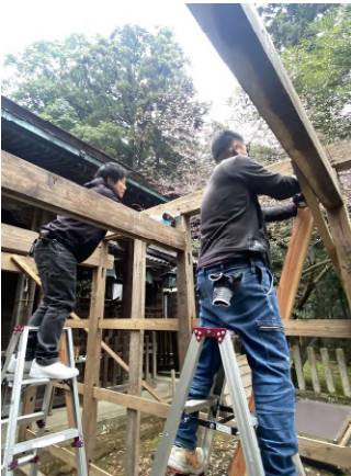
舟津神社さんの雪割りの解体。 社長と寺嶋で作業中。