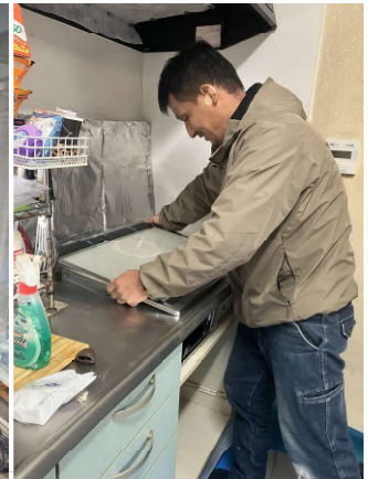
IHコンロの不具合で 新しく取替えることに。