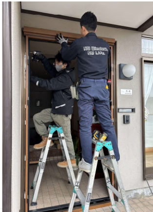
玄関ドアの入替え工事中。 新しい枠を取付けています。