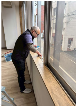
たさかる1番の一場さん。 現場の仕上げクリーニング。